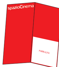
MEZZA PAGINA 9x9